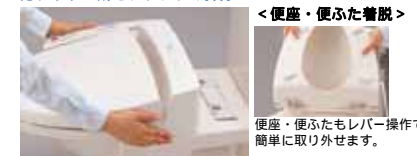
<便座・便ふた着脱>